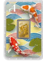
ลายหน้าทอง ปลาตู้