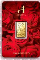
ลายหน้าทอง For My Love