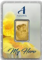
ลายหน้าทอง พี่