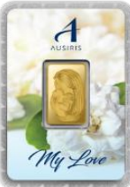
ลายหน้าทอง แม่