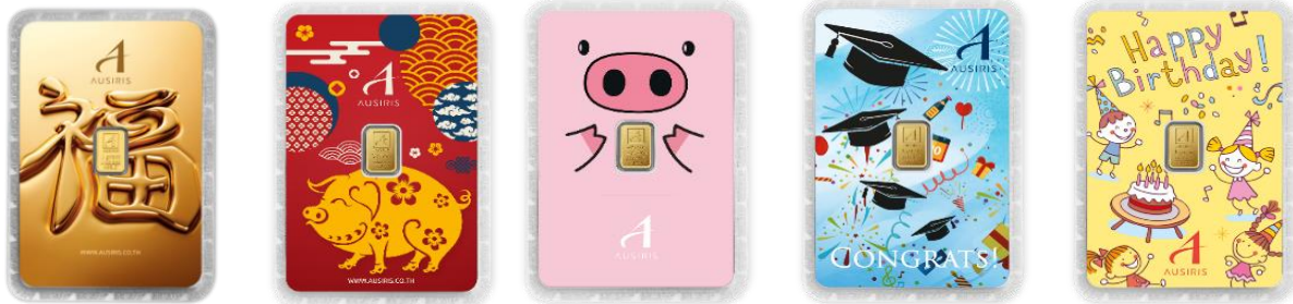
อักษรจีน