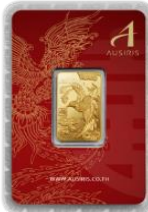
ลายหน้าทอง หงส์