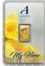
ลายหน้าทอง My Hero(พี่)