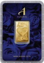
ลายหน้าทอง หัวใจ