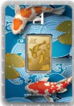
ลายหน้าทอง ปลาตู้