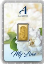
ลายหน้าทอง My Love(แม่)