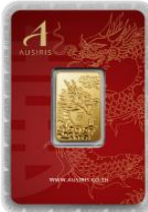
ลายหน้าทอง มังกร